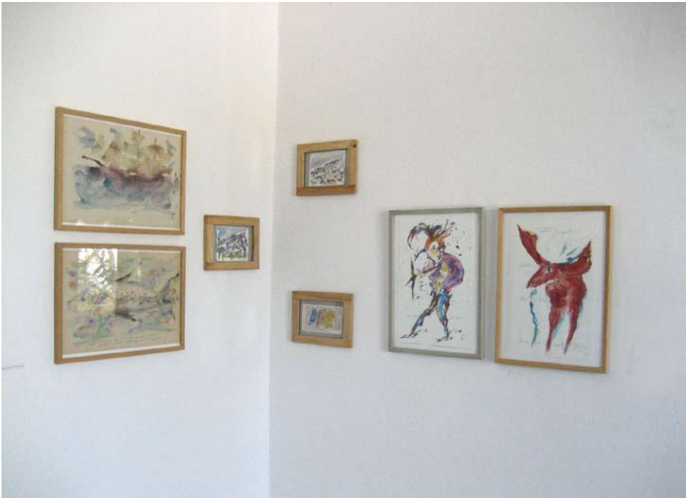
Aquarelle auf Papier, 2010