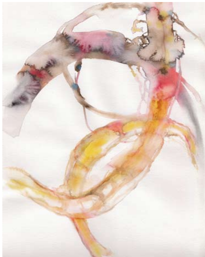
„tresopen_2“, Aquarell auf Papier, 24 x 32 cm, 2010