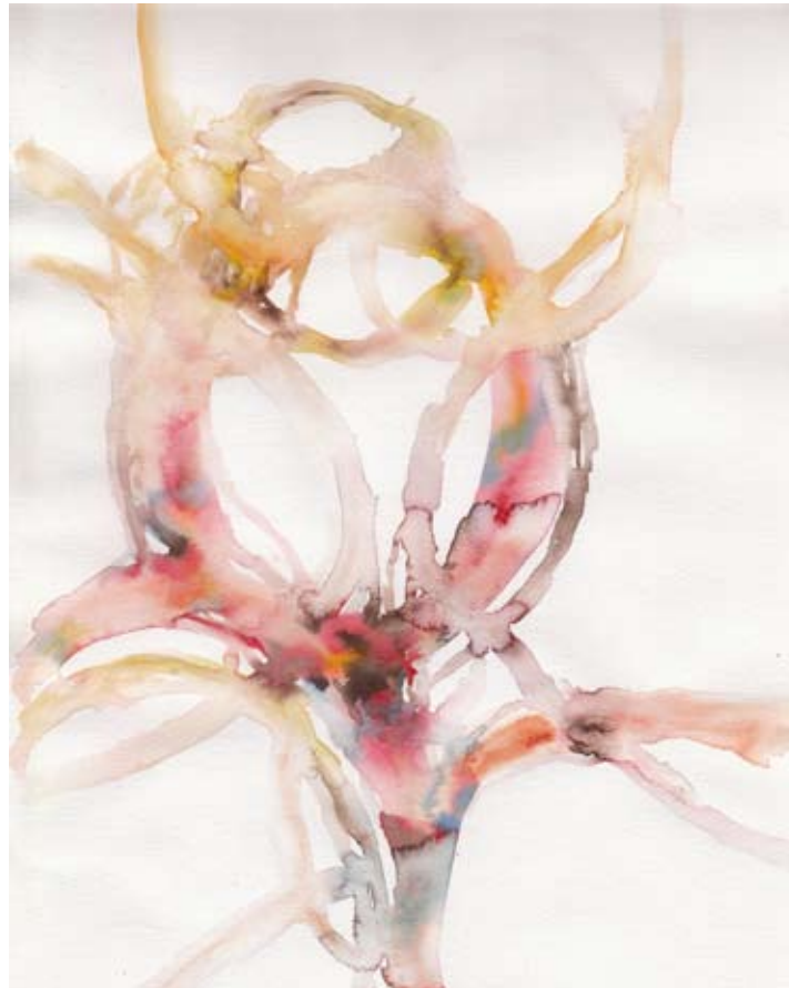
„tresopen_1“, Aquarell auf Papier, 24 x 32 cm, 2010