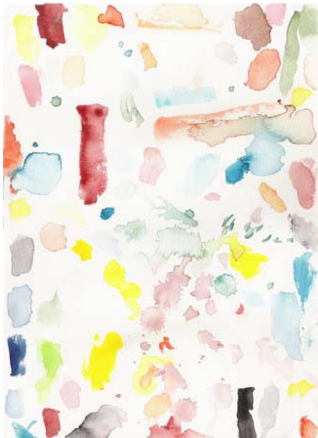
„2_petras_wasser“, watercolour, 40 x 60 cm, 2009