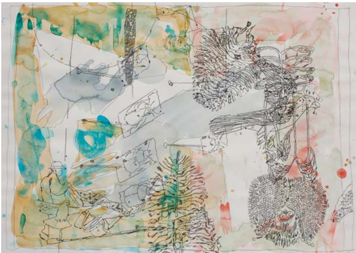
Unternehmen Lichtung /4, 2008, Wasserfarben, Farbstift auf Papier, 42 x 60 cm