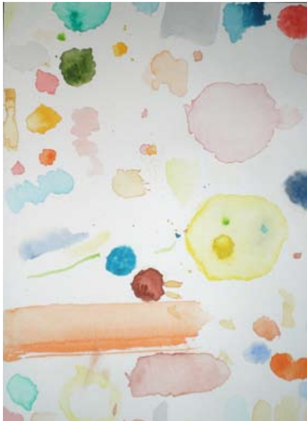
„1_wasser“, watercolour, 40 x 60 cm, 2008