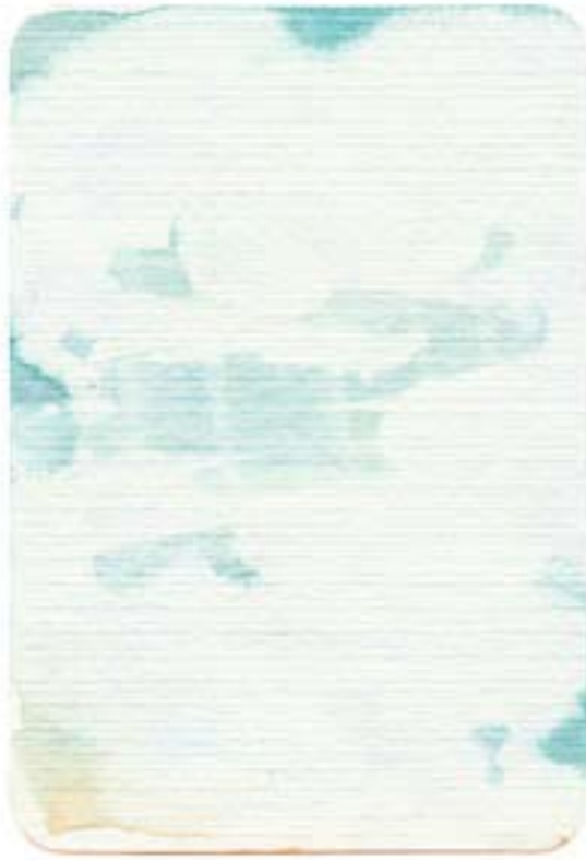
„L.K.W.“, Aquarell auf Papier, 15,3x 10,4 cm, 2010