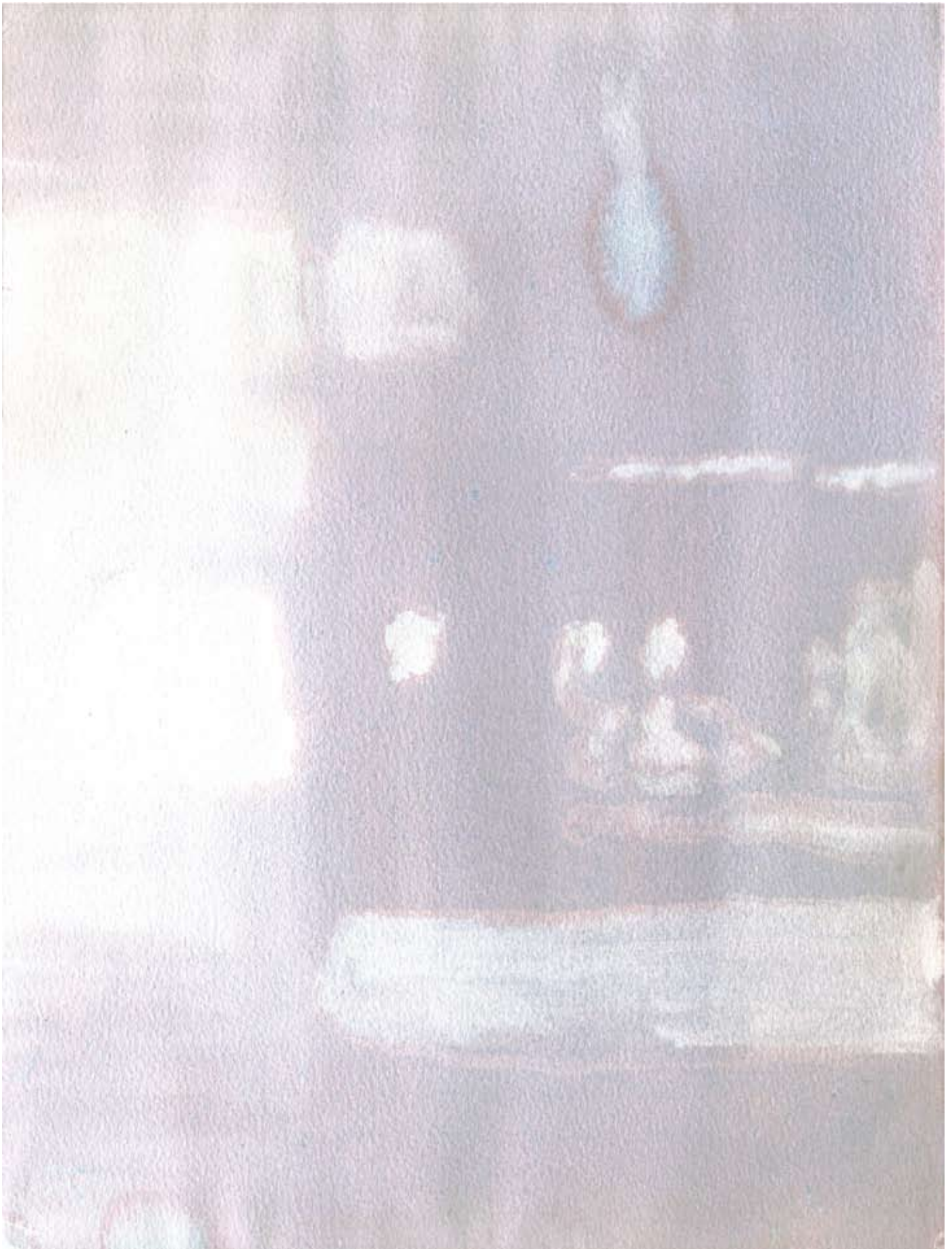
„InstantSpaces_3“, watercolour, 2010