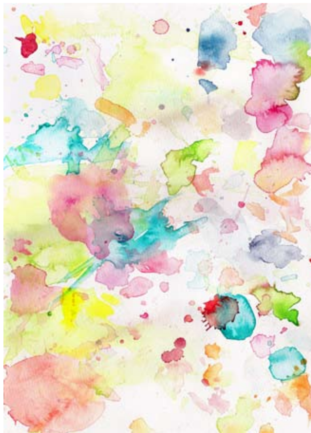
„11_aquarell“, watercolour, 40 x 60 cm, 2009