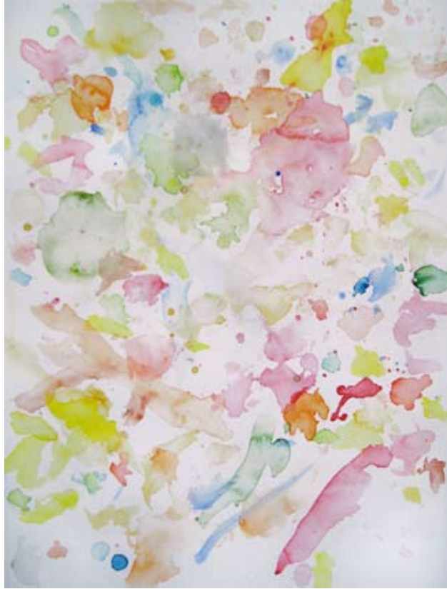
„9_aqua“, watercolour, 40 x 60 cm, 2010