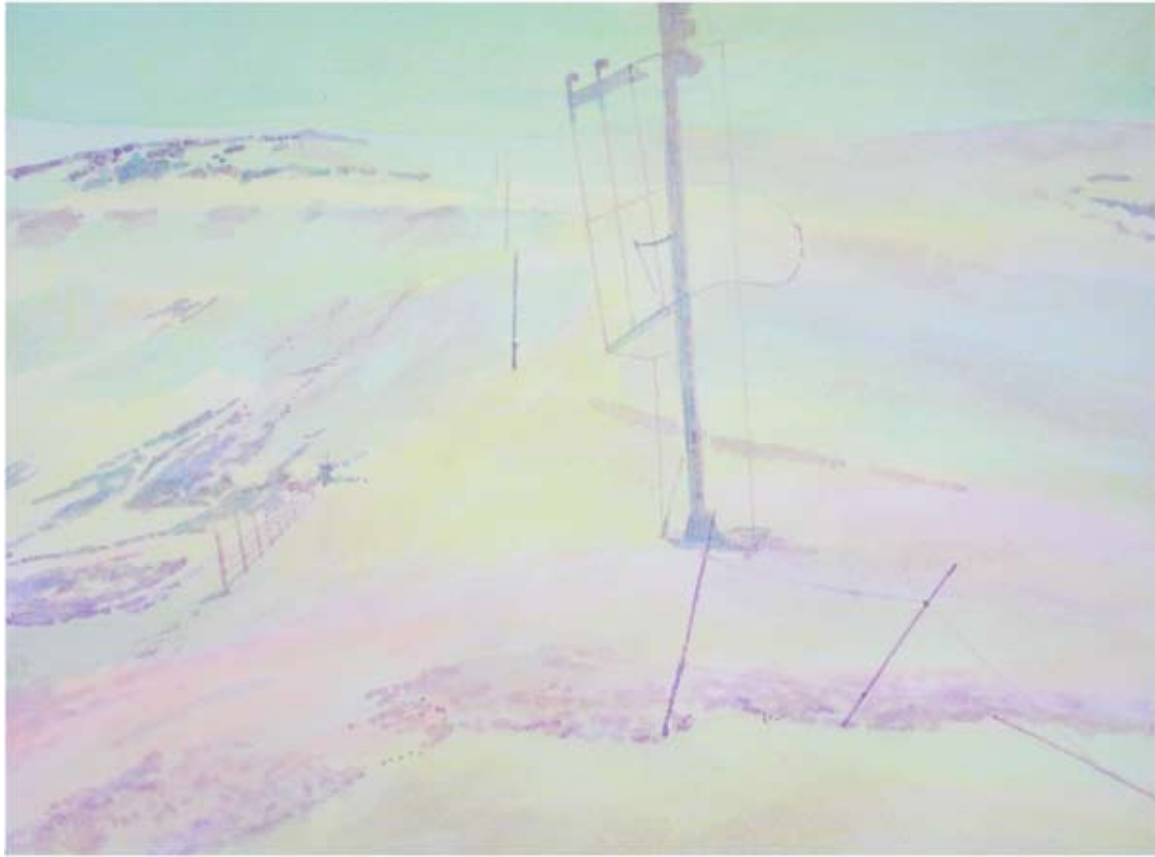
„Iceland “ , 24 x 32 cm, watercolour, 2010