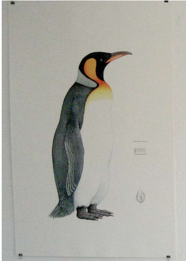
„Pinguin“, watercolour, 140 x 100 cm, 2010