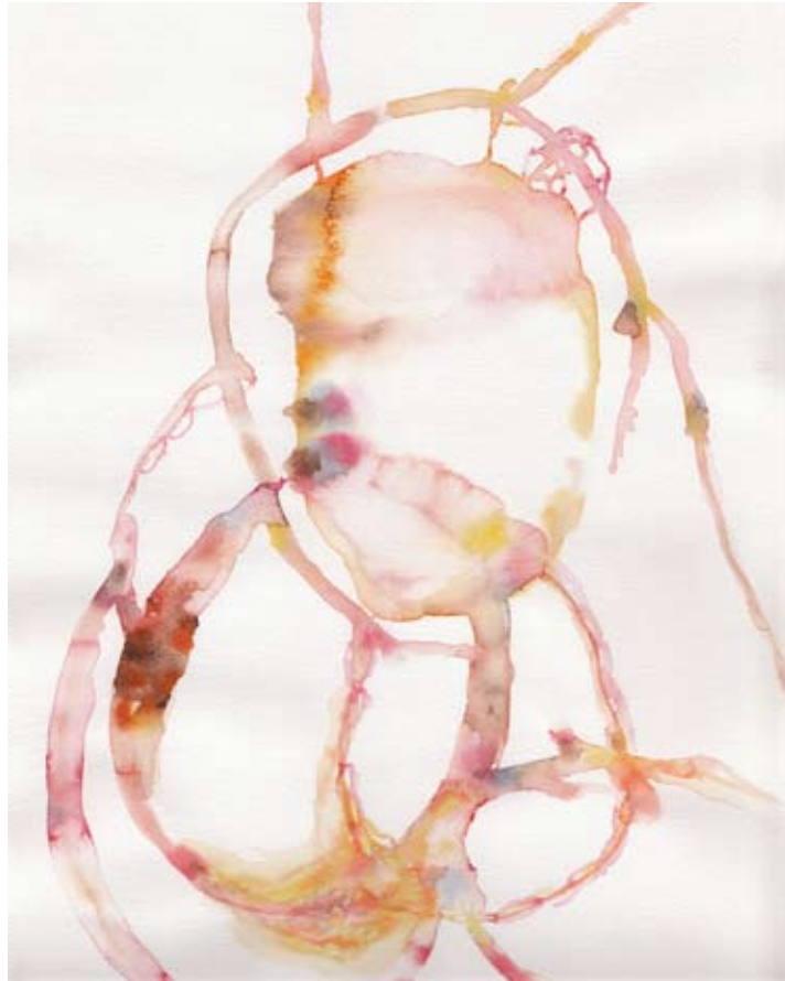
„tresopen_3“, Aquarell auf Papier, 24 x 32 cm, 2010