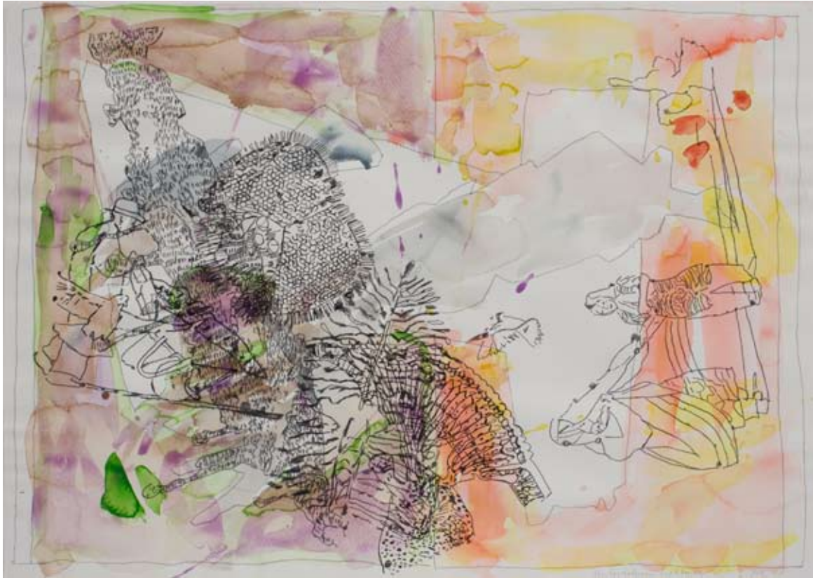
Unternehmen Lichtung /6, 2008, Wasserfarben, Farbstift auf Papier, 42 x 60 cm