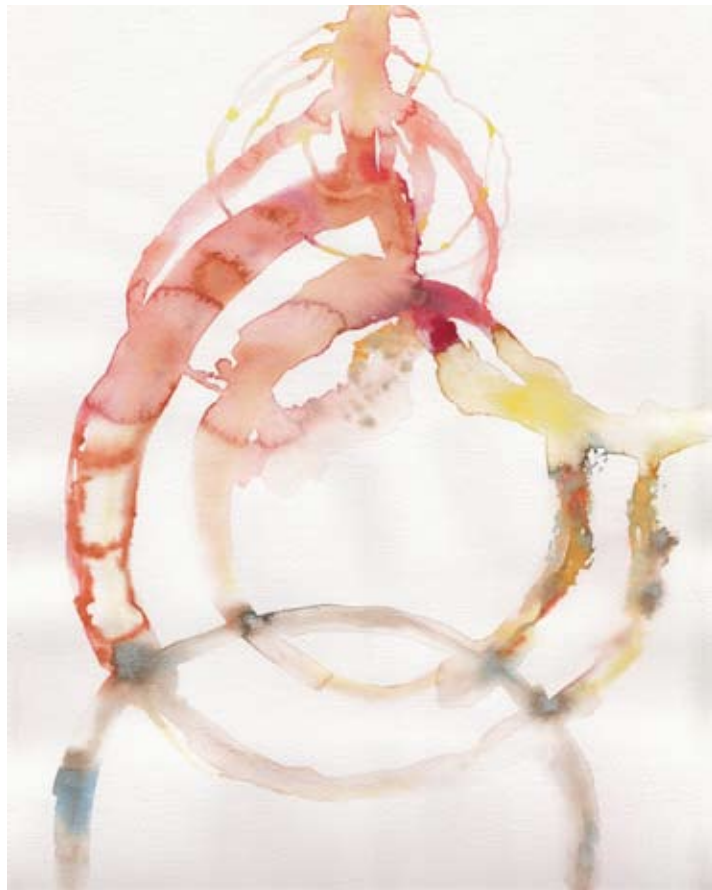
„tresopen_4“, Aquarell auf Papier, 24 x 32 cm, 2010