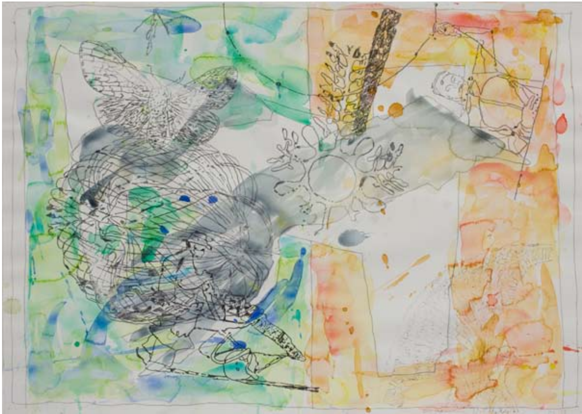
Unternehmen Lichtung /1, 2008, Wasserfarben, Farbstift auf Papier, 42 x 60 cm