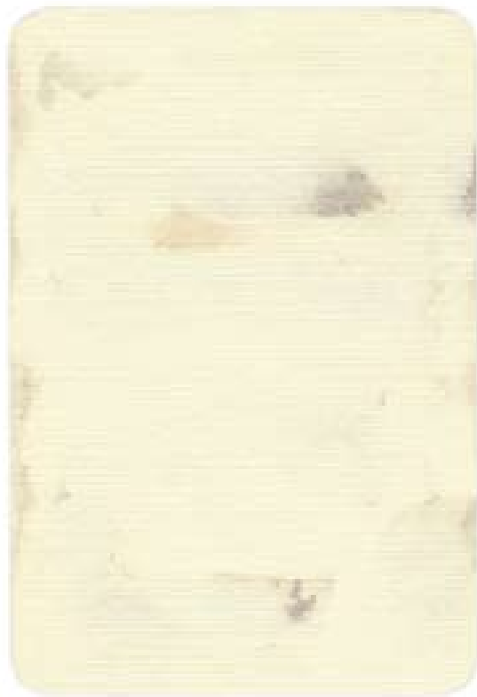
„belle vue“, Aquarell auf Papier, 15,3x 10,4 cm, 2010