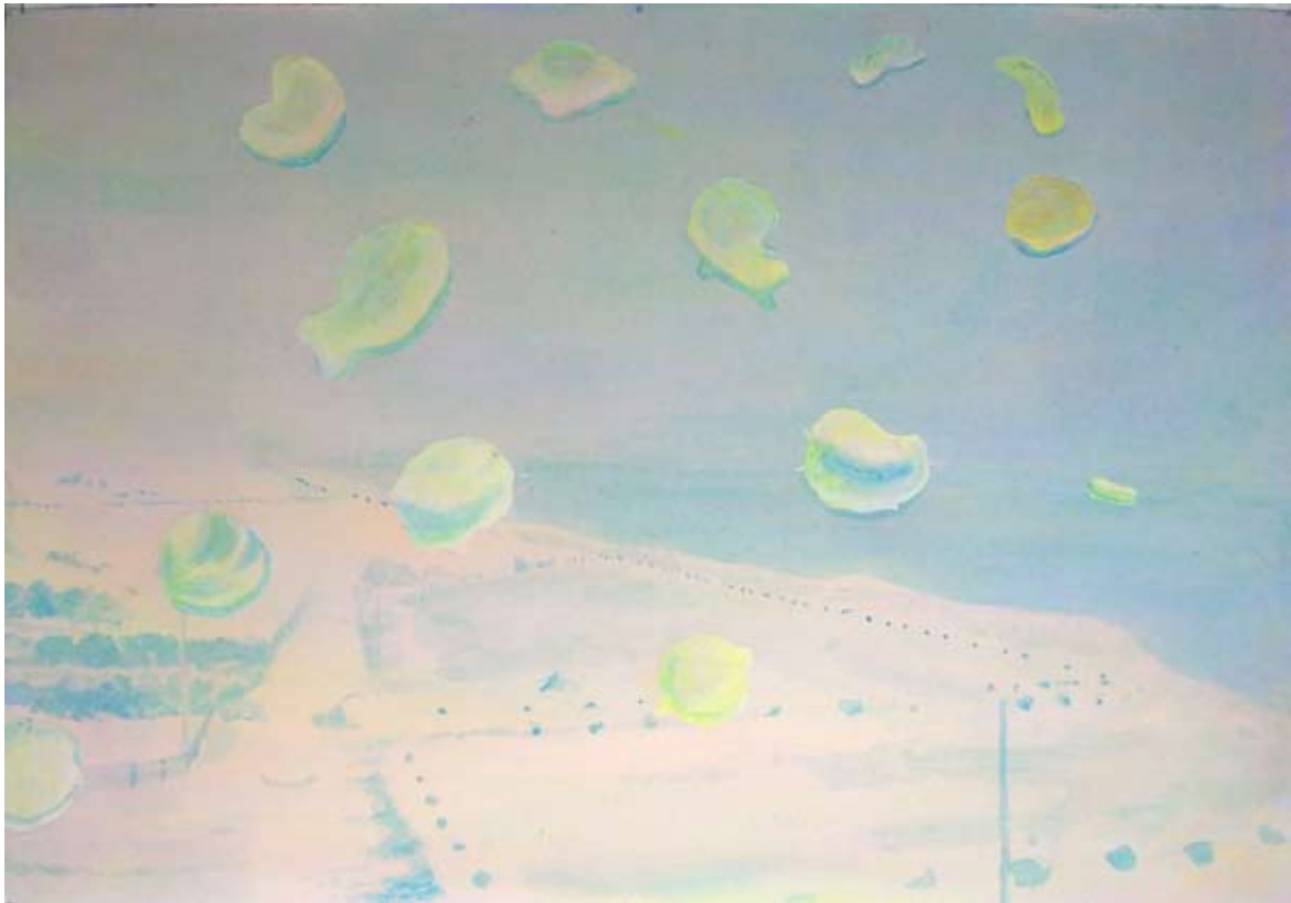
„am Strand“, 30 x 40 cm, watercolour, 2010